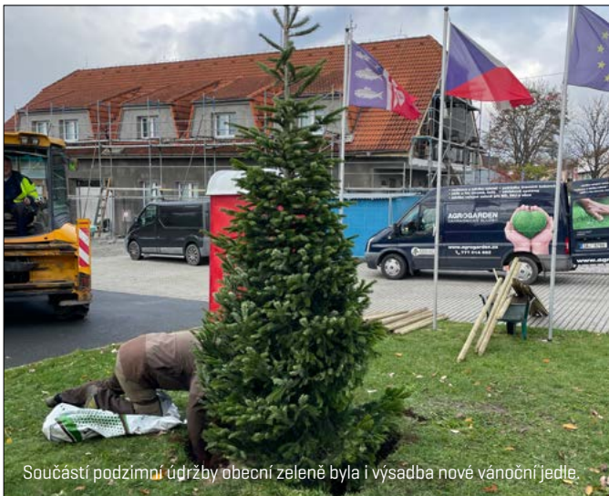
Součástí podzimní údržby obecní zeleně byla i výsadba nové vánoční jedle.