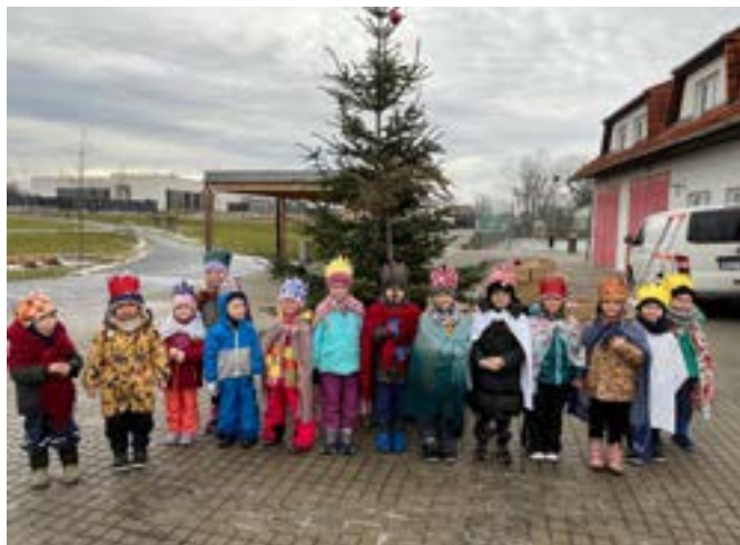
Děti s koledou nevynechaly ani obecní úřad, kde na ně čekaly za odměnu sladkosti.