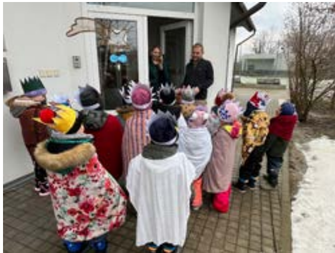
Mateřská škola pořádala již tradiční tříkrálový průvod.