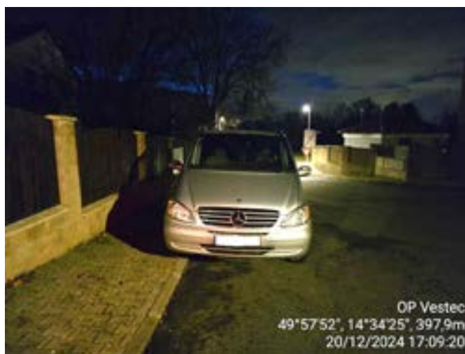
OP Vestec 49°57'52", 14°34'25", 397,9m 20/12/2024 17:09:20