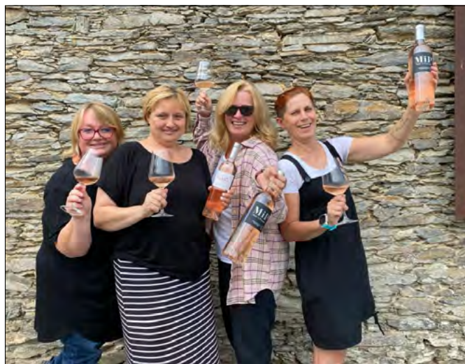
Tým z herinské vinotéky se na vás těší v každou roční dobu.

■ Milan Hulínský ve spolupráci s Vinotékou Herink